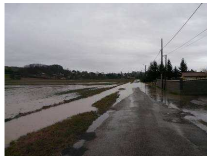
Inondation champs et habitations