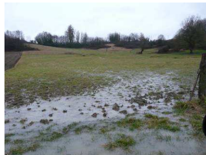
Ecoulement en provenance du coteau